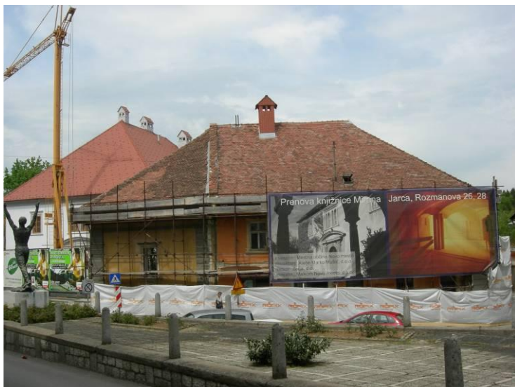
Rozmanova ulica 26

Zgradba Rozmanova ulica 26 je bila zgrajena precej kasneje, o njenem stavbnem razvoju je malo podatkov (objekt naj bi bil star dobrih 100 let). Razpored zidov nakazuje, da je imel objekt najbrž predvsem stanovanjsko namembnost (do druge svetovne vojne je bil v lasti družine Gošnik, nato pa je bil nacionaliziran). Sredi petdesetih let dvajsetega stoletja je objekt prevzela knjižnica.