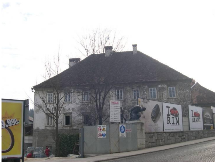
Rozmanova ulica 28

Stari del objekta Knjižnica Mirana Jarca v Novem mestu sestavljata dve zgradbi. Starejša (Rozmanova ulica 28) je bila pozidana v drugi polovici osemnajstega stoletja na mestu podrth zgradb mestnega špitala in cerkve Sv. Martina (objekt je bil zgrajen iz materiala podrth zgradb, ohranjeni so bili posamezni arhitektonski elementi – notranji prečni kletni zid naj bi bil npr. ostanek mestnega srednjeveškega obzidja). O starosti zgradbe priča sklepnik kamnitega portala z vklesano letnico 1779, vzidan v steno ob glavnem vhodu v objekt Rozmanova ulica 28. V na novo zgrajen objekt se je vselil okrožni urad ("kresija"), ki je tam deloval do leta 1850. Objekt se je nato približno sto let uporabljal za različne namene, nakar se je vanj leta 1954 vselila knjižnica. Od takrat se na objektu do sredine devetdesetih let niso izvajala večja vzdrževalna dela.