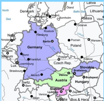
Osredotočenje projekta EffCoBuild

KLJUČNA DEJANJA: TRAJNOSTNO ENERGETSKO ZDRUŽENJE